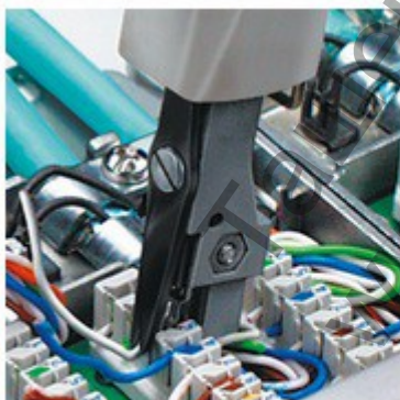
Притискане и отрязване на кабела в един работен ход