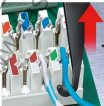
С интегрирана изтегляща кука